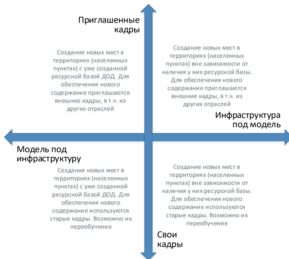
Рис. 6. Шкалы выбора модели инфраструктурного и кадрового обеспечения для типовой модели создания новых мест дополнительного образования

Следует отметить, что механизмы инфраструктурного и кадрового обеспечения не существуют в полярных вариантах. Решения даже в рамках реализации одной модели будут различны. Анализ перечисленных выше характеристик позволяет сделать эти точечные решения более точными и эффективными.