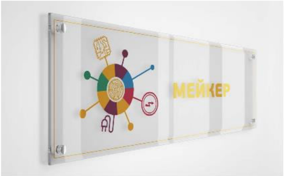
Примеры зонирования и визуализации современных пространств