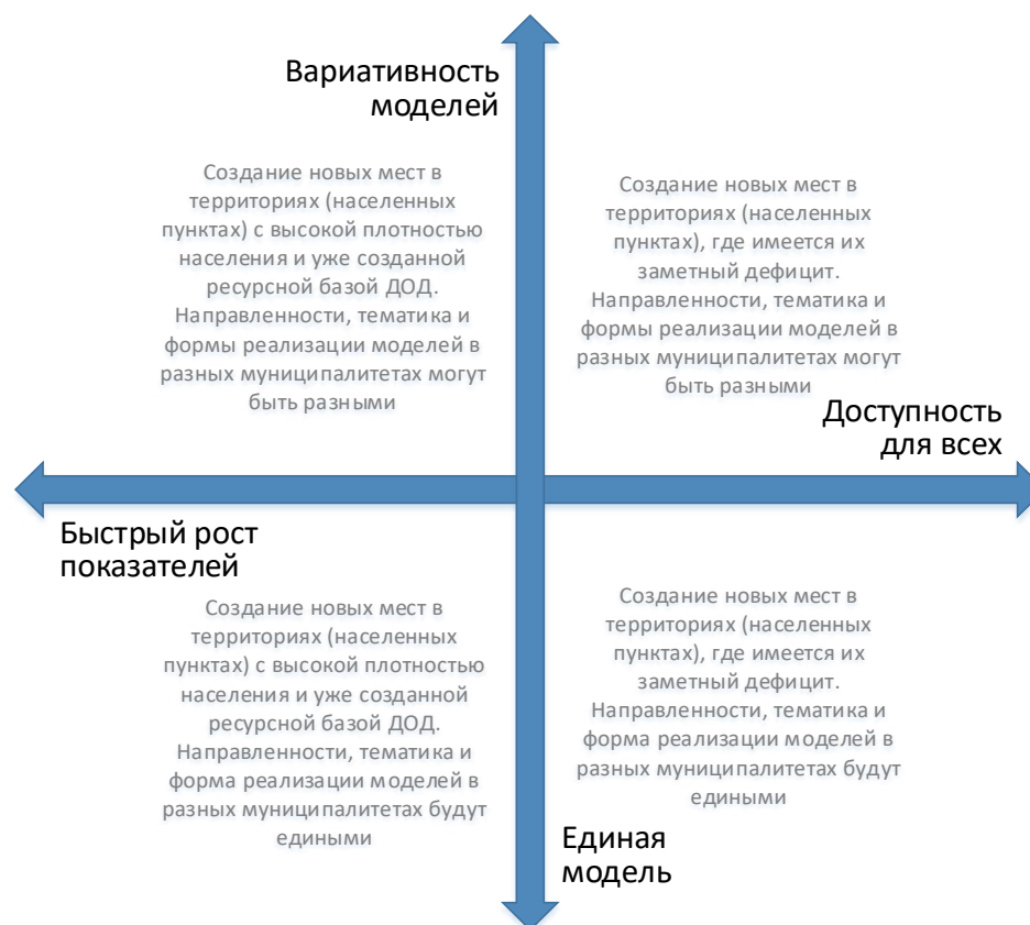
Рис. 4. Шкалы выбора модели создания новых мест с учетом актуальной управленческой политики