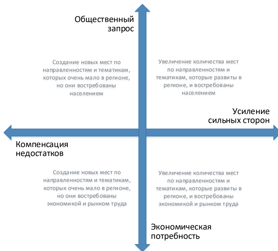
Рис. 2. Шкалы выбора тематики и тактики создания новых мест дополнительного образования