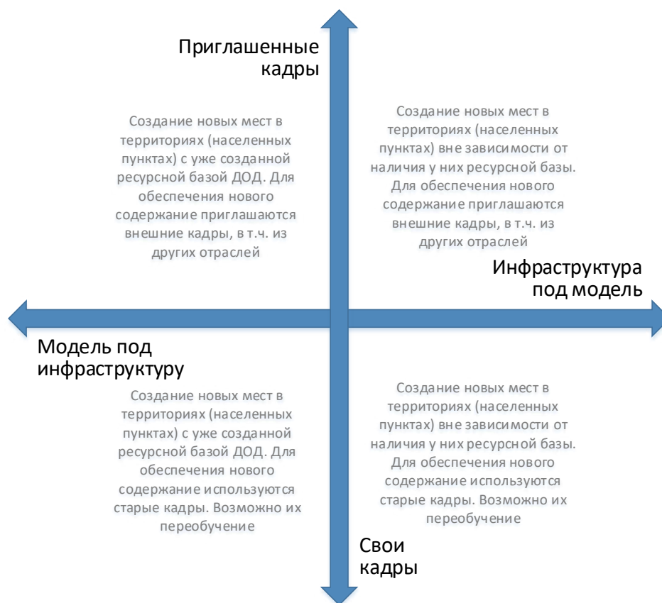
Рис. 6. Шкалы выбора модели инфраструктурного и кадрового обеспечения для типовой модели создания новых мест дополнительного образования

Следует отметить, что механизмы инфраструктурного и кадрового обеспечения не существуют в полярных вариантах. Решения даже в рамках реализации одной модели будут различными. Анализ перечисленных выше характеристик позволяет сделать эти точечные решения более точными и эффективными.