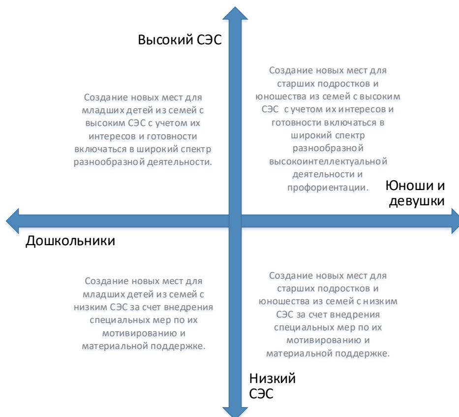
Рис. 5. Шкалы выбора модели создания новых мест по программам туристско-краеведческой направленности с учетом особенностей контингента обучающихся