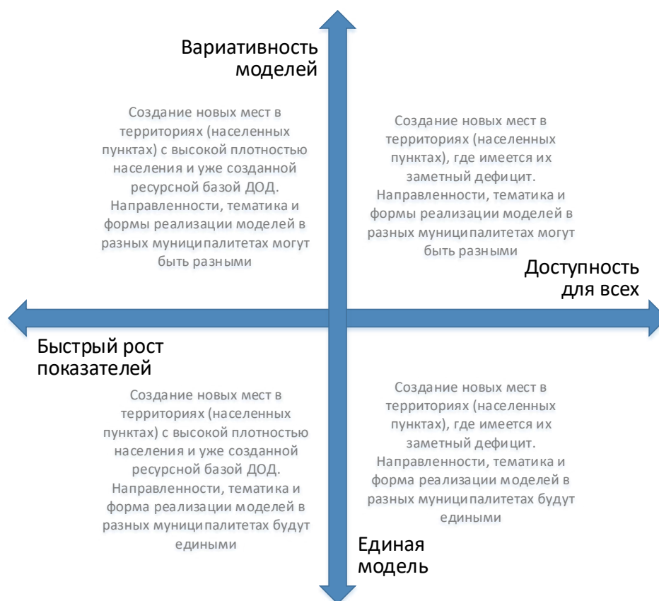
Рис. 4. Шкалы выбора модели создания новых мест с учетом актуальной управленческой политики

2) чем выше образовательный и культурный статус семьи (родителей), тем больше отдача от вкладываемых средств, особенно в части ресурсоемких и инновационных программ. Можно вложить значительные средства в создание высококлассных кружков по туризму в поселке с низким социокультурным статусом семей, но не получить востребованность у населения. Также можно целевым образом выделить сертификаты малообеспеченным семьям конкретно на эти кружки, но пришедших в них будет все равно крайне мало. Увеличение отдачи в этом случае потребует дополнительных вложений на проведение агитационных и рекламных мероприятий, эффективной информационной стратегии (рис. 4).