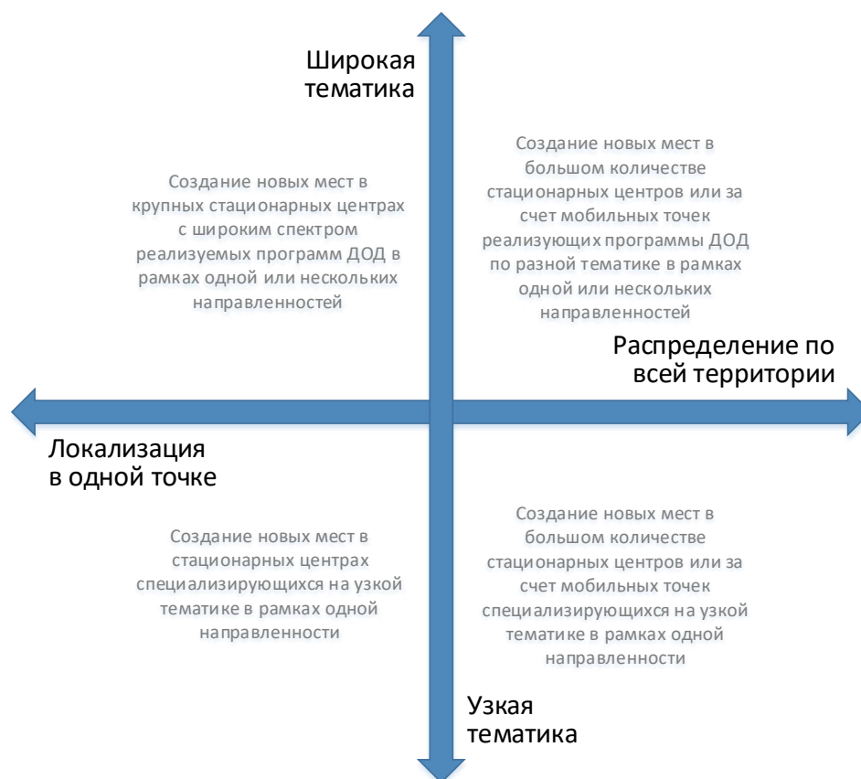
Рис. 3. Шкалы выбора масштаба и формы реализации новых мест по программам ДОД

При невыполнении хотя бы одного из них возникает необходимость пространственного распределения реализуемой модели через мобильные или сетевые решения.