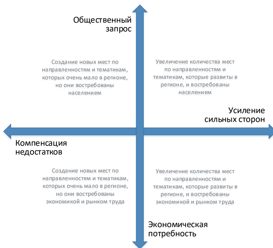
Рис. 2. Шкалы выбора тематики и тактики создания новых мест дополнительного образования

Итогом этого этапа выбора, построенного на основе самообследования и анализа полученных данных, станет определение приоритетного(ных) для региона образовательного(ных) направления (модулей) модели (рис. 2).