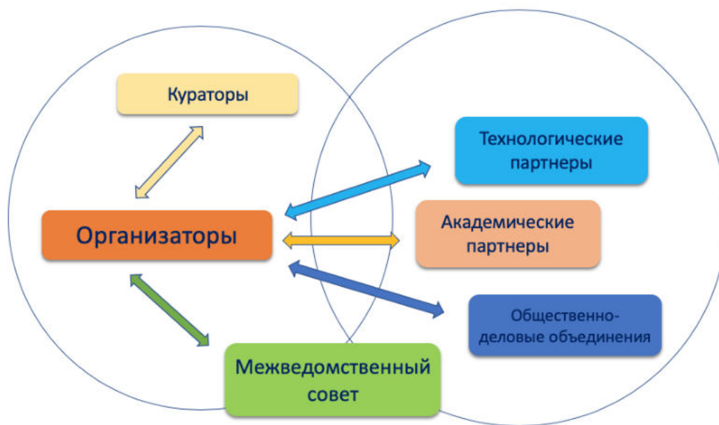
Рис. 1. Схема взаимодействия участников мероприятий по внедрению и функционированию типовой модели «Спортика»

Схема взаимодействия участников мероприятий по внедрению и функционированию типовой модели «Спортика» приведена на рис. 1.