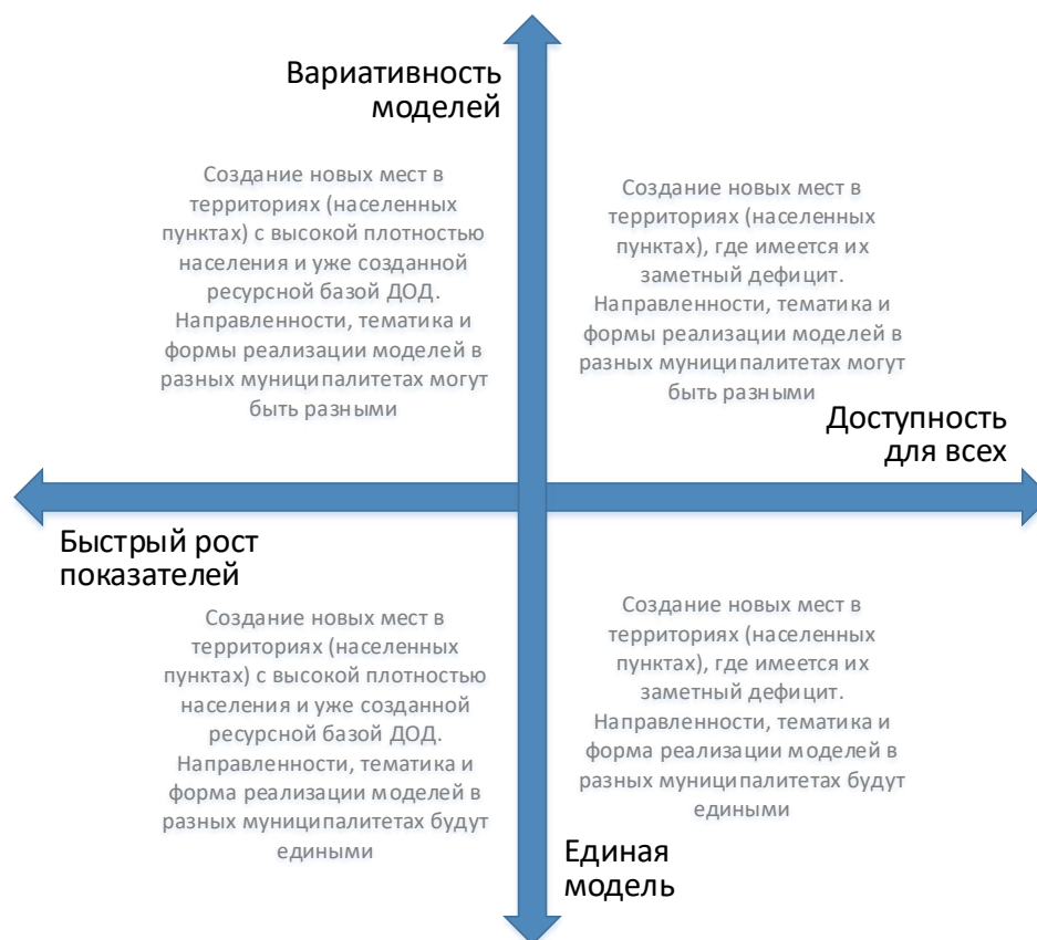
Рис. 4. Шкалы выбора модели создания новых мест с учетом актуальной управленческой политики