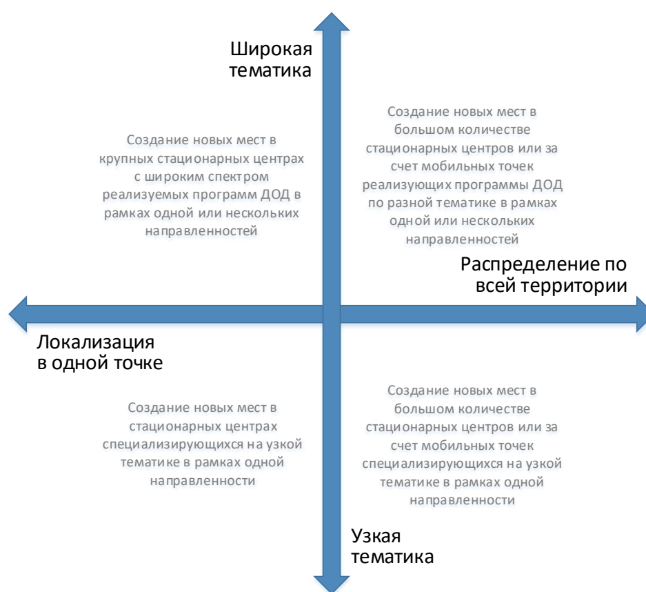
Рис. 3. Шкалы выбора масштаба и формы реализации новых мест по программам ДОД

При невыполнении хотя бы одного из них возникает необходимость пространственного распределения реализуемой модели через мобильные или сетевые решения.