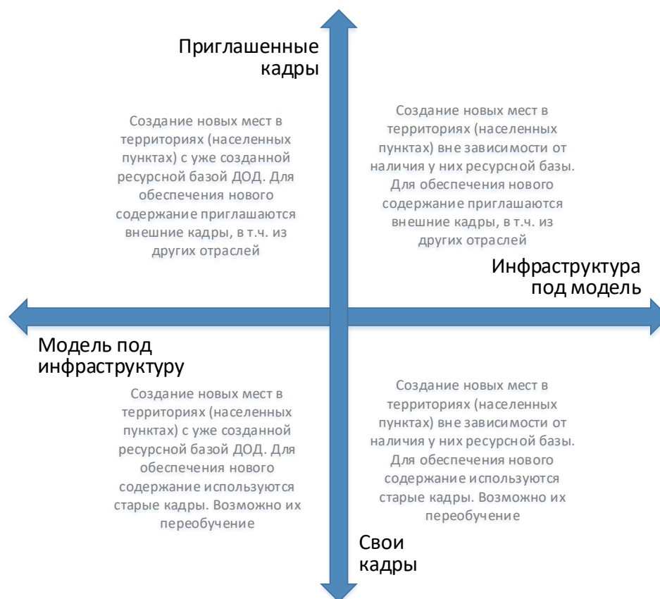
Рис. 6. Шкалы выбора модели инфраструктурного и кадрового обеспечения для типовой модели создания новых мест дополнительного образования

Следует отметить, что механизмы инфраструктурного и кадрового обеспечения не существуют в их полярных вариантах. Решения даже в рамках реализации одной модели будут различны. Анализ перечисленных выше характеристик позволяет сделать эти точечные решения более точными и эффективными.