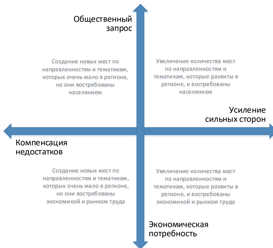
Рис. 2. Шкалы выбора тематики и тактики создания новых мест дополнительного образования