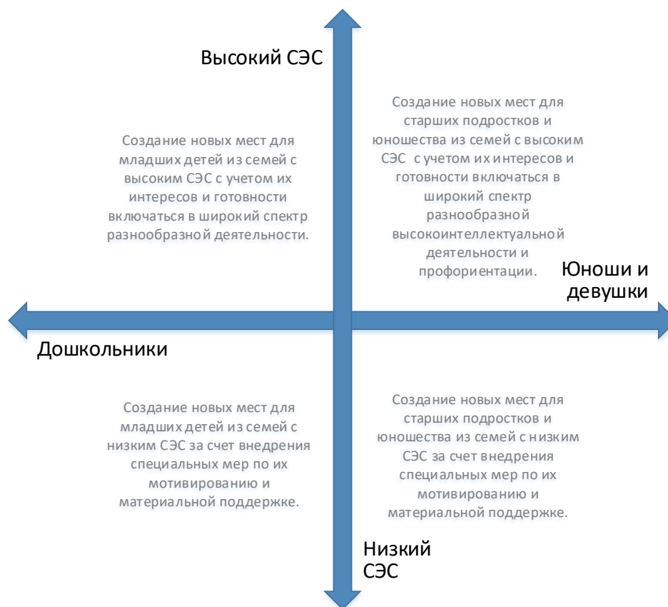
Рис. 5. Шкалы выбора модели создания новых мест по программам физкультурно-спортивной направленности с учетом особенностей контингента обучающихся

Вовлечение в программы детей из семей с низким образовательным и культурным уровнем потребует осуществления определенных PR-шагов, поиска мотиваторов для данных детей, в том числе материальных.