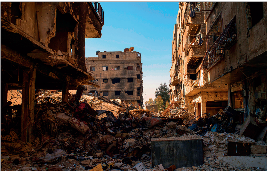
Разрушенный боевиками ИГИЛ Дамаск.

Террористы поставили на поток производство видеороликов с жестокими сценами казней пленников, заложников и «вероотступников». Эти материалы потом широко распространяются в социальных сетях и