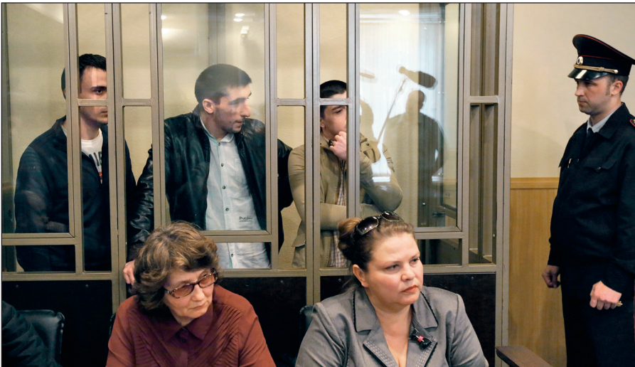
В Российской Федерации предусмотрена административная и уголовная ответственность за пропаганду идей терроризма, участие в деятельности террористических организаций.