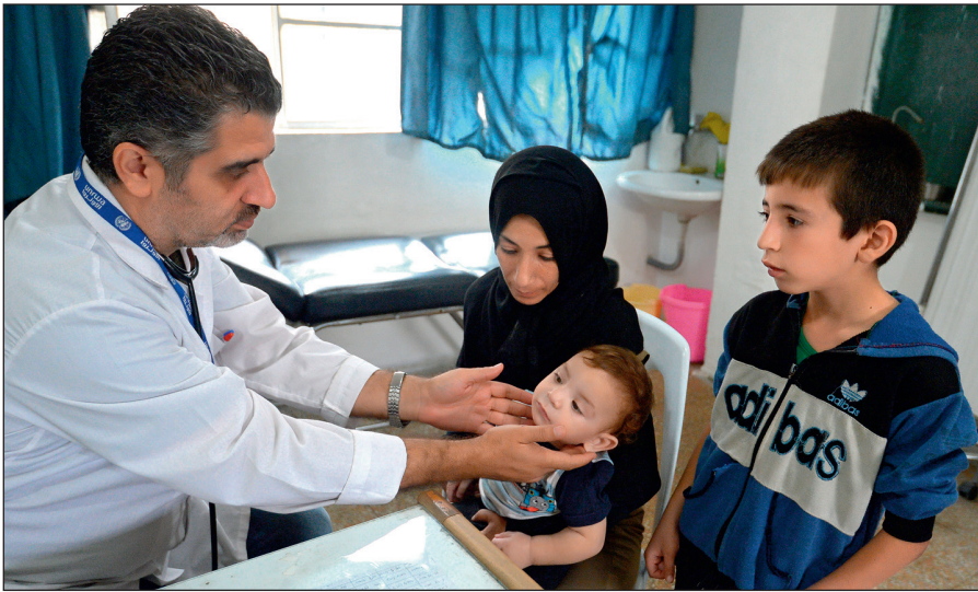
Истинный ислам призывает к состраданию и милосердию. Врач осматривает ребенка в медицинском пункте лагеря при одной из школ Дамаска.

Радикалы объявляют «врагами ислама» всех несогласных с ними мусульман. Ультрарадикальные группировки признают террор и насилие единственным способом достижения провозглашенных ими целей.