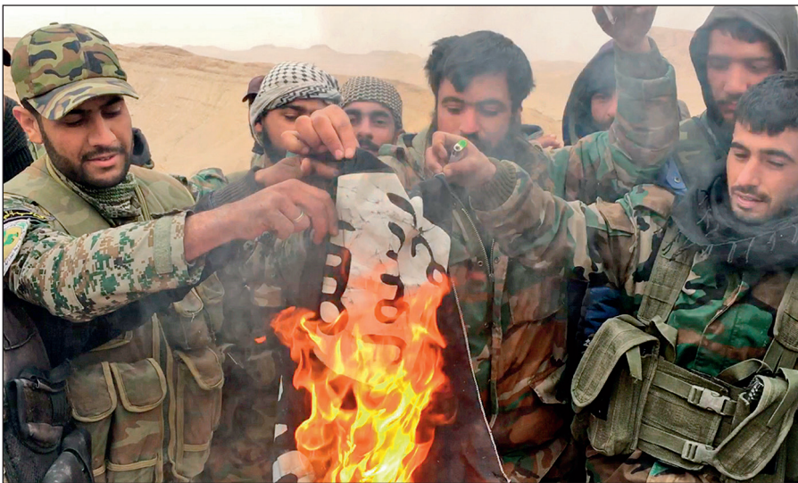
Народные ополченцы САР сжигают флаг ИГИЛ, снятый с отбитой у боевиков цитадели Пальмира.

Современное государство обязано защищать интересы каждого своего гражданина вне зависимости от его расы, национальности, принадлежности к определенной конфессии или религиозной традиции, в то время как ИГИЛ выражает интересы небольшой группы религиозных радикалов, жестоко подавляя остальную часть населения посредством запугивания, насилия и террора.