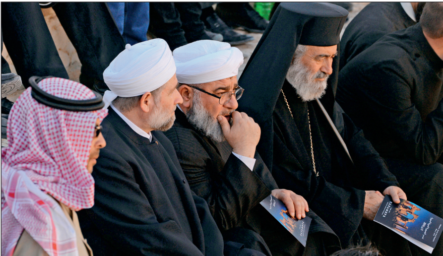
Представители различных конфессий объединились против ИГИЛ. На концерте симфонического оркестра петербургского Мариинского театра в Римском амфитеатре сирийской Пальмиры, освобожденной от террористов ИГИЛ.

В последнее время появилось значительное число верующих, причисляющих себя к крайним религиозным течениям (в СМИ упоминаются как «салафиты», «хариджиты», «ваххабиты»). Однако костяк ИГИЛ составляют лишь люди, причисляющие себя к ультрарадикальному крылу вышеназванных течений.